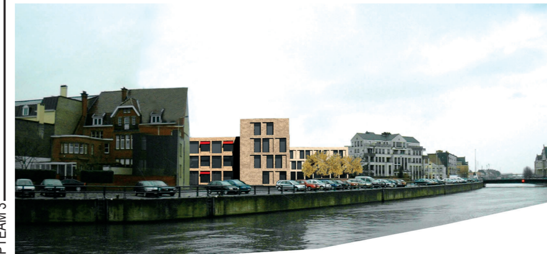
Fonteyne - Van den Berg - Vierin (noA.architecten)