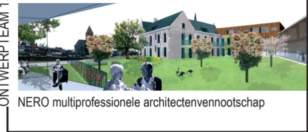
NERO multiprofessionele architectenvereniging