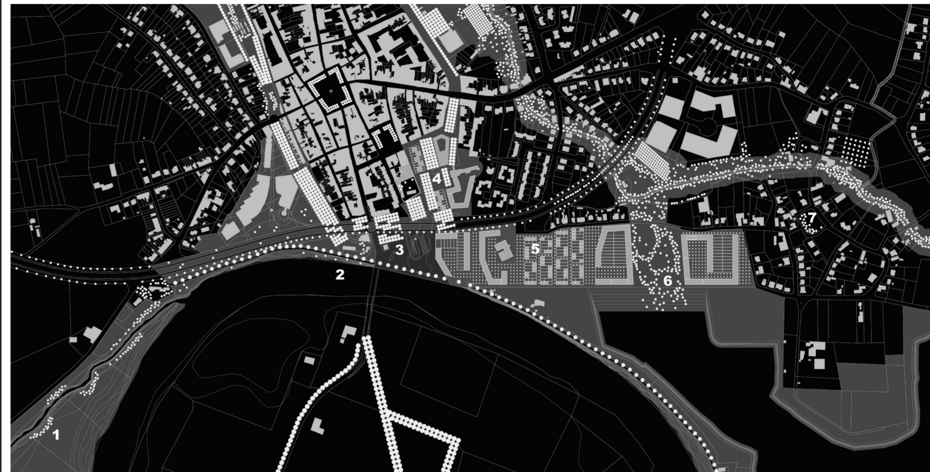
1. Ruigtelandschap 2. Maasbrug 3. Stadswalpark – Transferiumplein Maaseik 4. Woon- en zorgcentrum 5. Hoogdynamisch, kleinstedelijk stadsdeel 6. Bosbeekpark 7. Dorpsplein Aldeneik