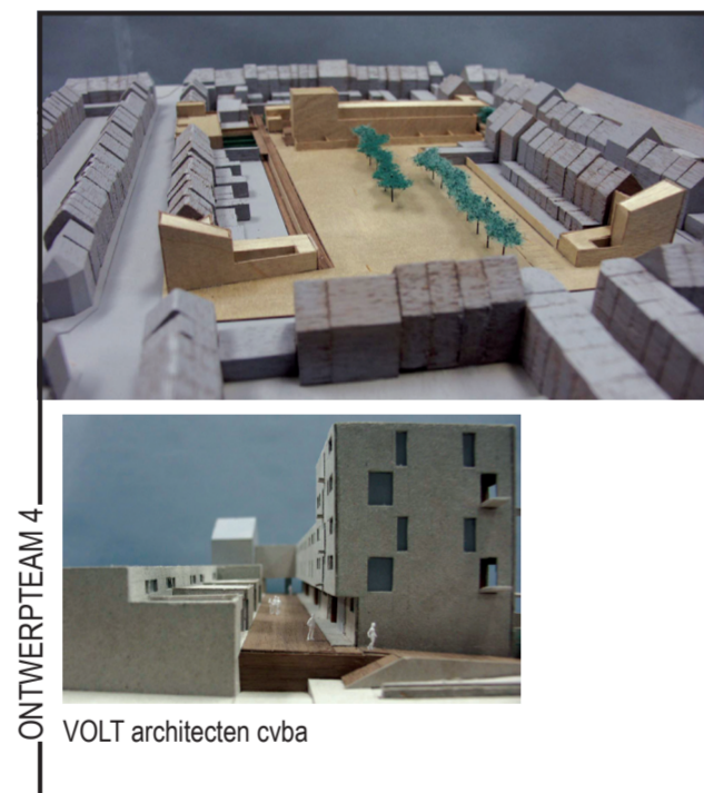
VOLT architecten cvba