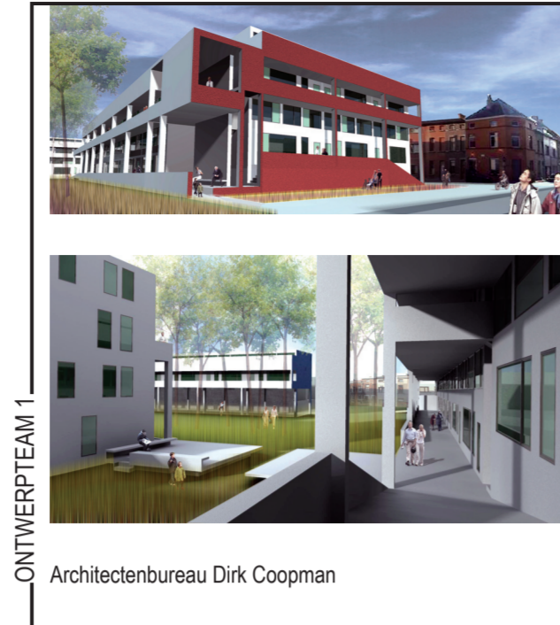
Architectenbureau Dirk Coopman